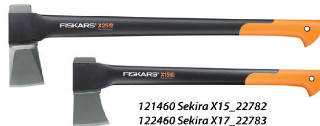
121460 Sekira X15_22782 122460 Sekira X17_22783 122480 Sekira X25_22784