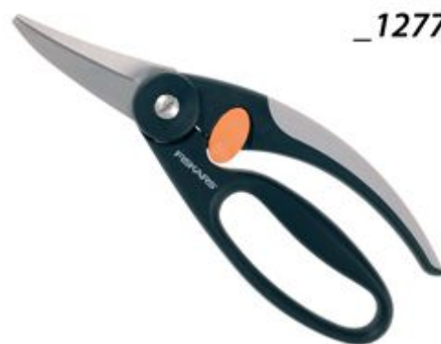
111450 Makaze univerzalne_12779