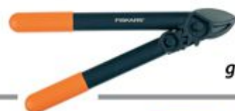
112170 Makaze za grane_12796