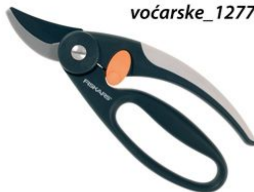
111440 Makaze za orezivanje voćarske_12778