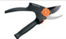
111520 Makaze za orezivanje voćarske_12783