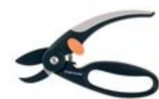
111430 Makaze voćarske za orezivanje_12777