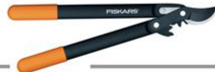
112200 Makaze za grane_12798