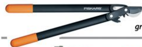
112290 Makaze za grane_12799